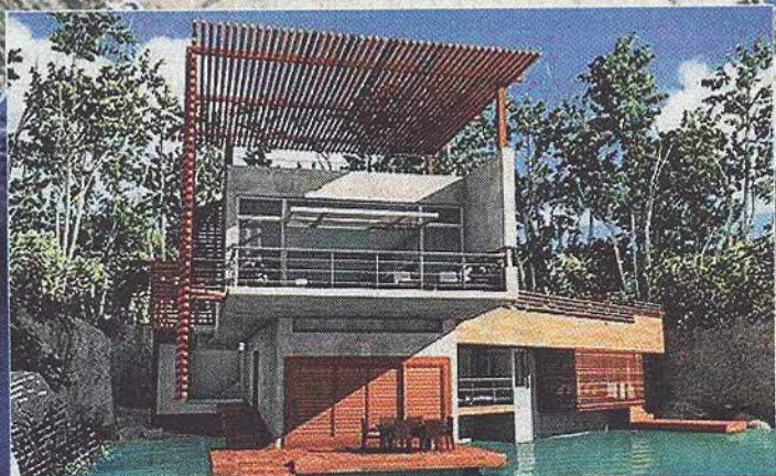
:: VILE, KAFIĆI, HOTELI Uz kanal planirana je gradnja tisuću "kreveta". Paško blato ostaje nedirnuto