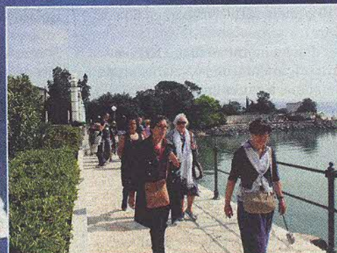
:: KILOMETRI ŠETNICE Uz cijelu dužinu južne obale kanala protezat će se atraktivno ureden lungo mare

Dok kanal Pag – Košljun kroz OTOK ČIPKE, SIRA I JANJETINE jedni pozdravljaju kao priliku za turistički razvitak otoka, drugi vrište kako je riječ o mutnim poslovima i projektu koji će uništiti okoliš